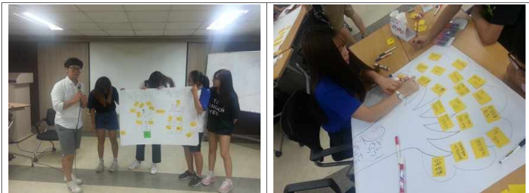
그림2. 2016년 하계 서울시학교협동조합 통합 워크숍