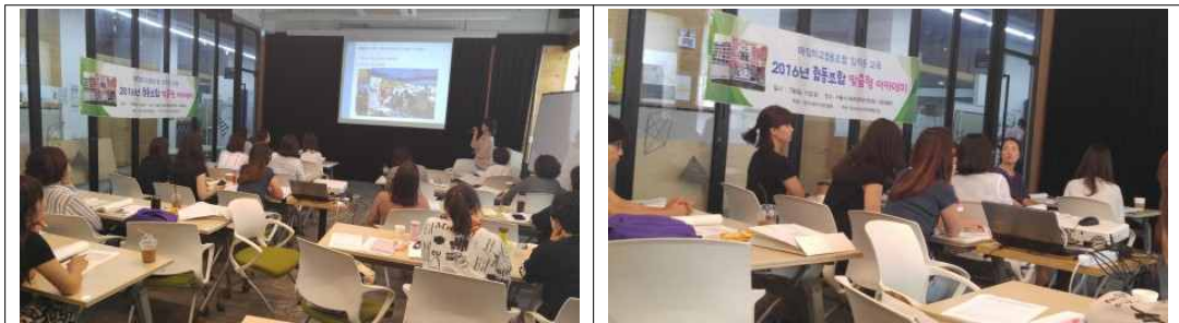
그림3. 2016년 하계 매점 학교협동조합 학부모임원교육