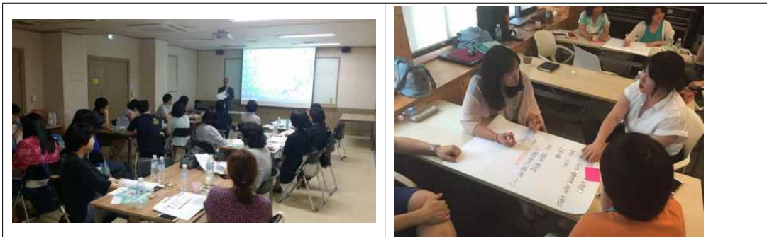
그림4. 2016년 2016 사회적경제&협동조합 교원연수